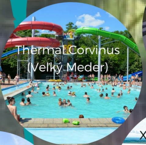
Thermal Corvinus (Veľký Meder)