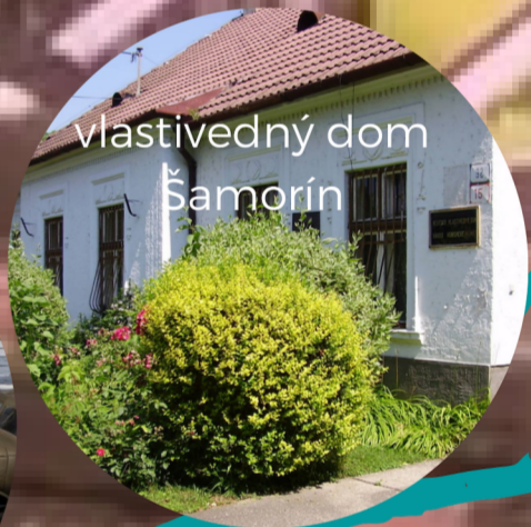
vlastivedný dom Šamorín