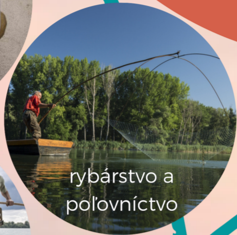
rybárstvo a poľovníctvo