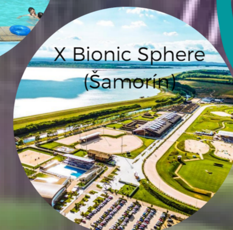
X Bionic Sphere (Šamorín)