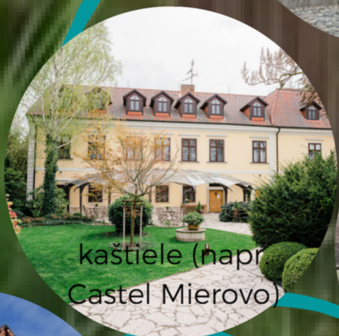
kaštiele (napr. Castel Mierovo)