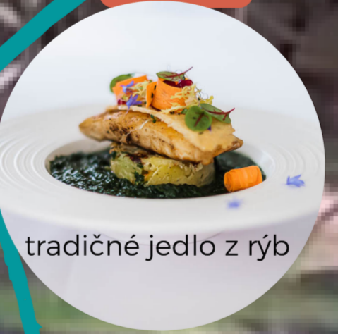
tradičné jedlo z rýb