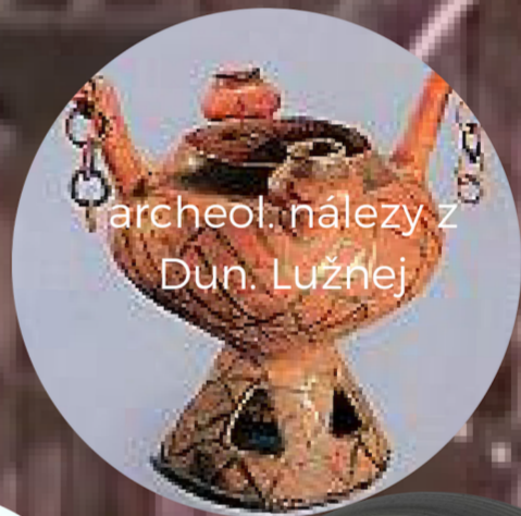
archeol. nález z Dun. Lužnej