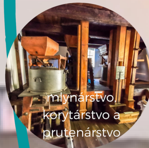
mlynárstvo, korytárstvo a prutenárstvo