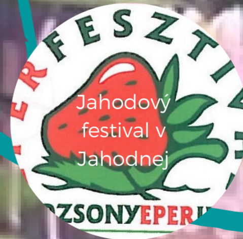
Jahodový festival v Jahodnej