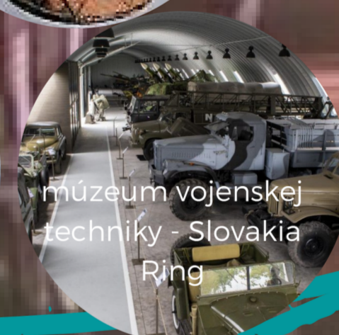
múzeum vojenskej techniky - Slovakia Ring