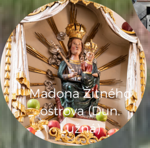
Madona Žitného ostrova (Dun. Lužnej)