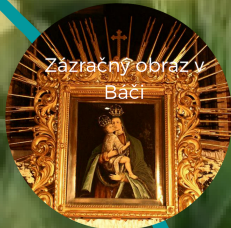
Zázračný obraz v Báci

Žitný ostrov má všetky predpoklady na rozvoj sakrálneho cestovného ruchu. Na území sa nachádza množstvo starých krásnych kostolíkov s bohatou výzdobou. Hustá sieť kostolov na tomto území bola postavená vďaka sv. Štefanovi , ktorý sa s cieľom šírenia kresťanstva veľa zdržiaval v tomto regióne.