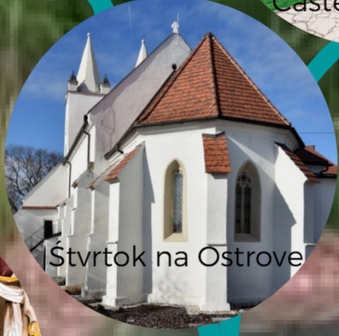
Štvrtok na Ostrove