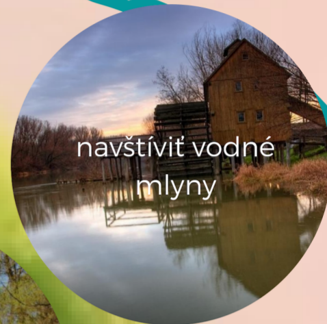
navštíviť vodné mlyny