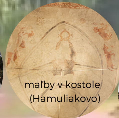
malby v kostole (Hamuliakovo)