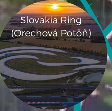
Slovakia Ring (Orechová Potôň)