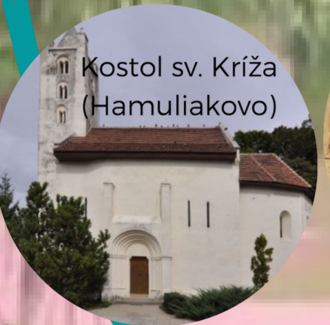
Kostol sv. Kríža (Hamuliakovo)