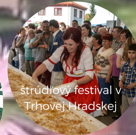
štrúdľový festival v Trhovej Hradskej

Na obrázku v pozadí je zobrazenie vodného mlynu v Dunajskom Klátove.