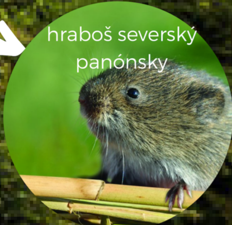
hraboš severský panónsky