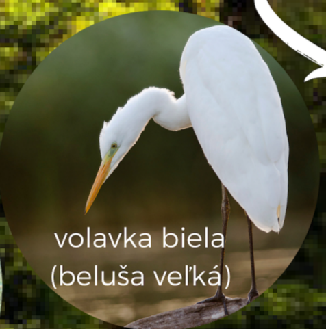
volavka biela (beluša veľká)